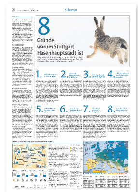
Stuttgarter Nachrichten: Alternative Storyform: Liste mit acht Punkten.