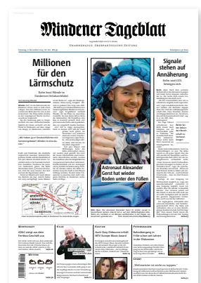
Mindener Tageblatt: Der Bildeinsatz konnte bei der Neugestaltung 2014 stark verbessert werden.